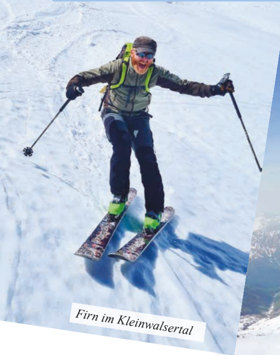
Firn im Kleinwalsertal