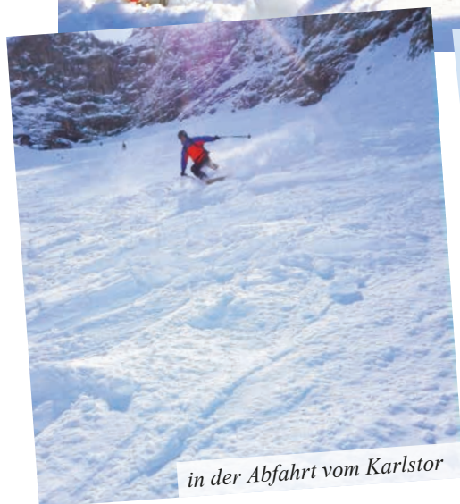
in der Abfahrt vom Karlstor