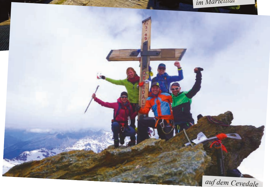
auf dem Cevedale