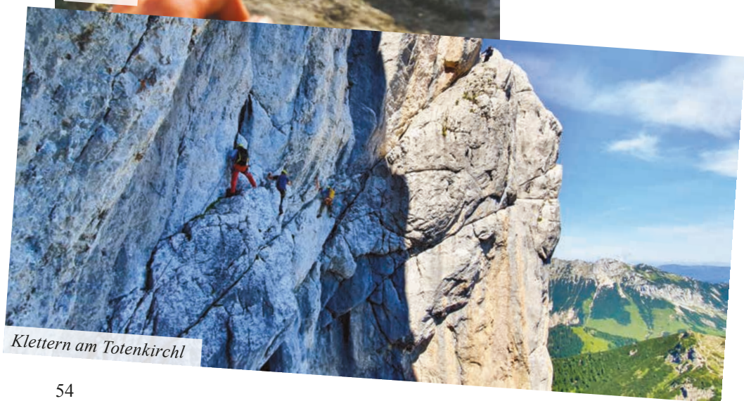
Klettern am Totenkirchl