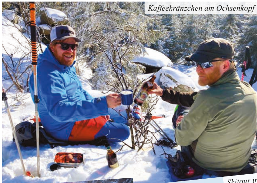
Kaffeekränzchen am Ochsenkopf