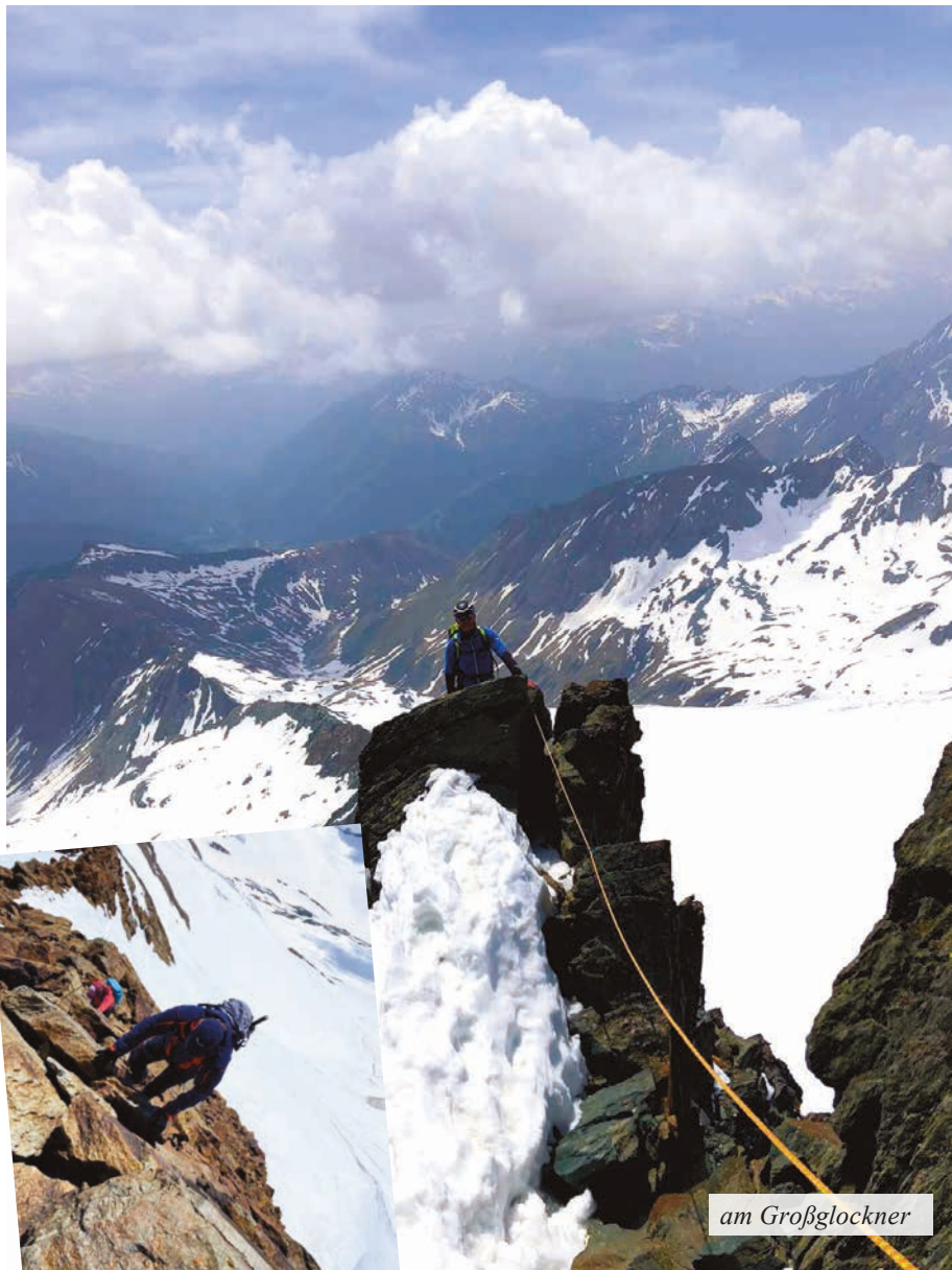
an der Zufallspitze