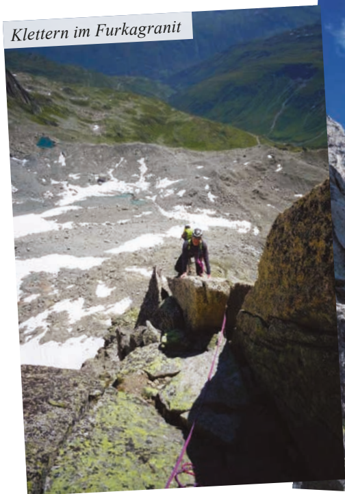
Klettern im Furkagranit