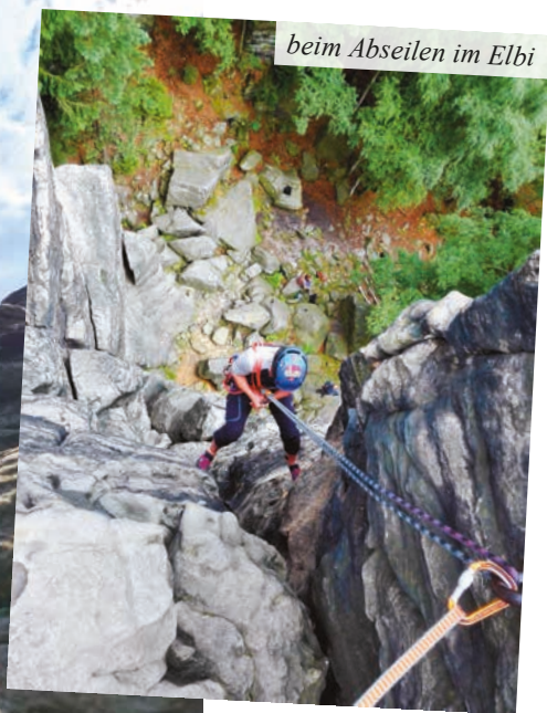
beim Abseilen im Elbi