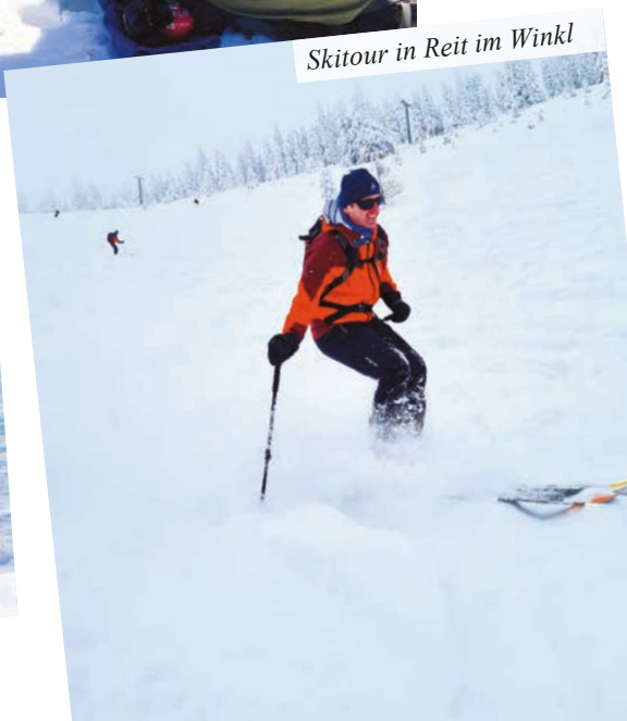
Skitour in Reit im Winkl