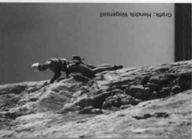
Grafik: Hendrik Wagensell