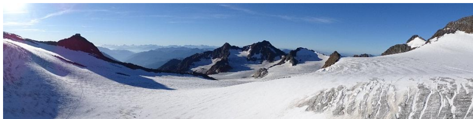
Gletscherpanorama im Stubai