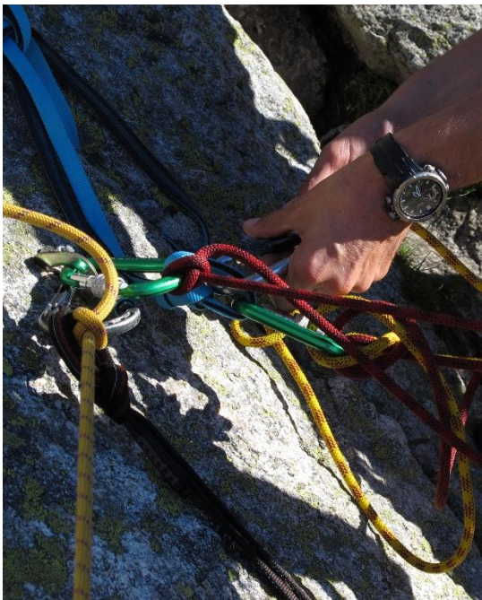
Gordischer Knoten oder Lehrbuchstandplatz?

Bei Fragen, Anregungen oder Kritik wende Dich bitte an unsere Geschäftsstelle oder unser Ausbildungsteam unter ausbildung@dav-forchheim.de .