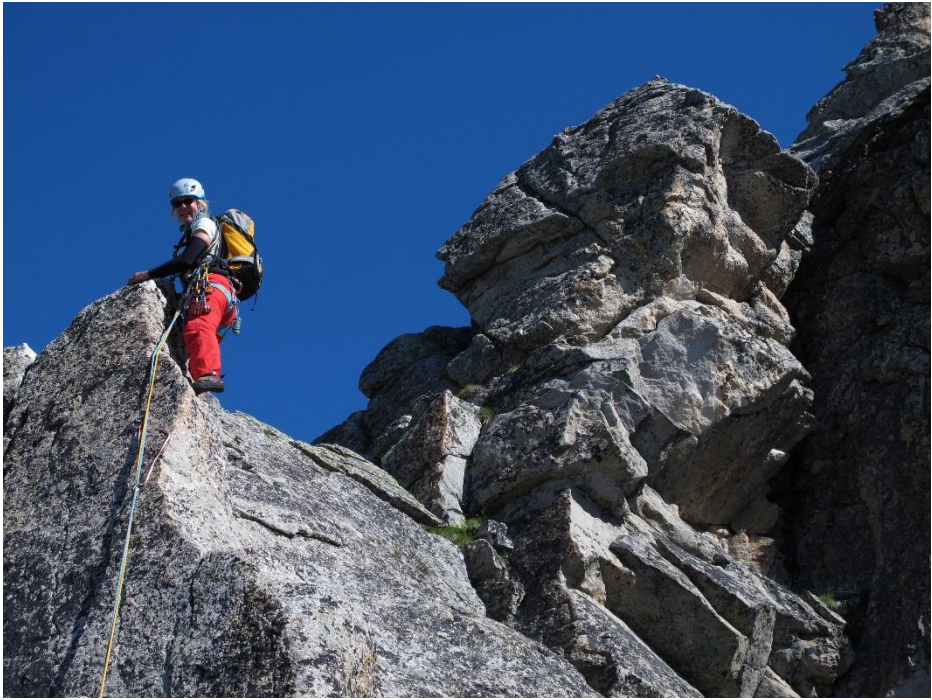
Klettern im Bergell