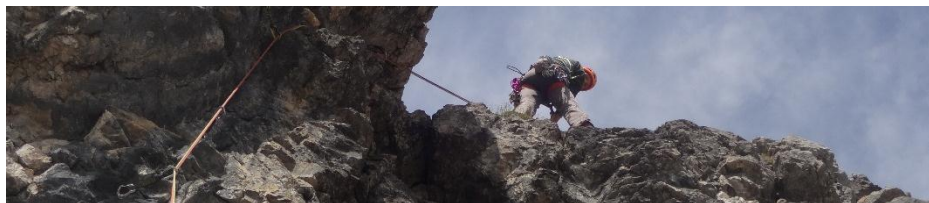
Nicht immer ganz fester Fels im Allgäu