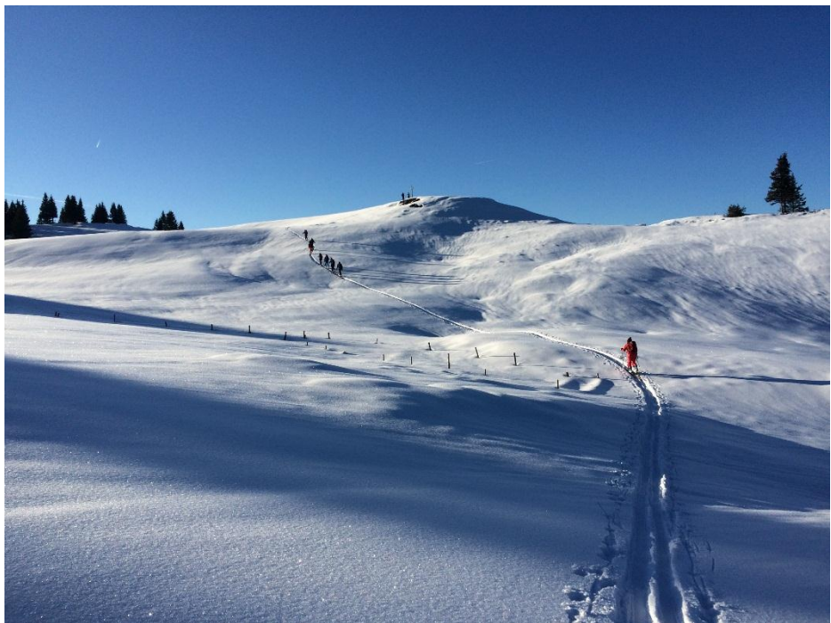
Auf Skitour in den Bayerischen Alpen